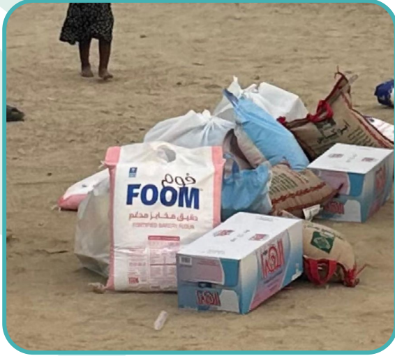
توثيق البرنامج :