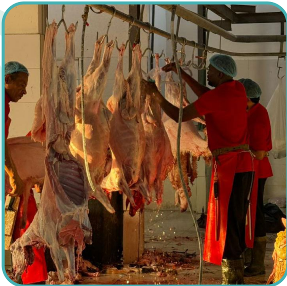
توثيق البرنامج :