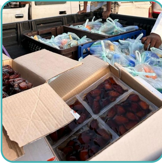
توثيق البرنامج :